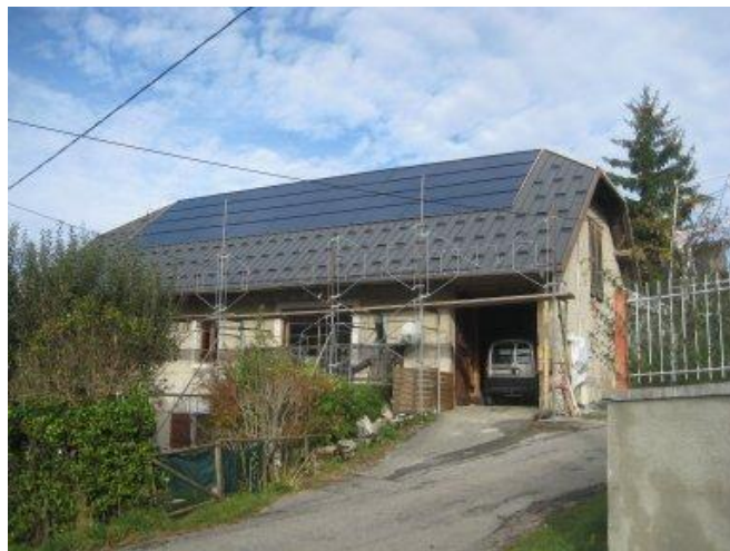
Toits de particuliers à Puygros et la Thuile

d'approvisionnement et leur coût (plus de 300 panneaux) ont été difficiles à assumer. Mais nous n'avons aucun regret cependant lorsque nous voyons le résultat !