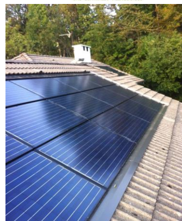
Toit de l'OPAC à La Thuile

Les deux dernières installations seront terminées ce printemps (mise en service prévue fin Avril 2015), la saison étant trop avancée pour tout terminer avant l'hiver qui est arrivé un peu trop vite.