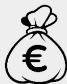
Rémunérer les actionnaires