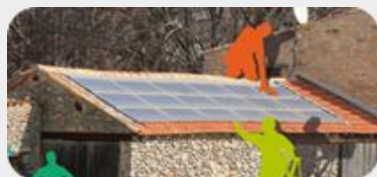
En proposant votre toiture