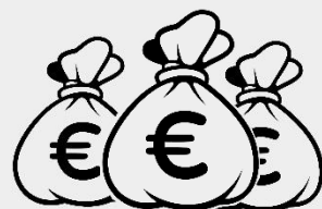
Investir dans de nouveaux projets