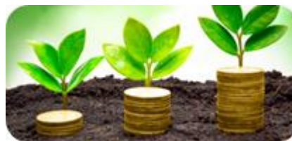
En devenant actionnaire de la SAS